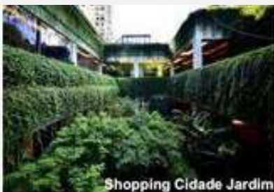
Shopping Cidade Jardim

O fundo XP Malls FII possui um dos maiores portfólios de shopping centers de alto padrão do Brasil.