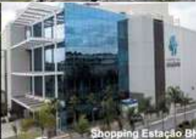
Shopping Estação BH