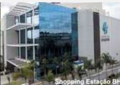
Shopping Estação BH