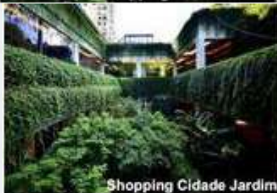
Shopping Cidade Jardim